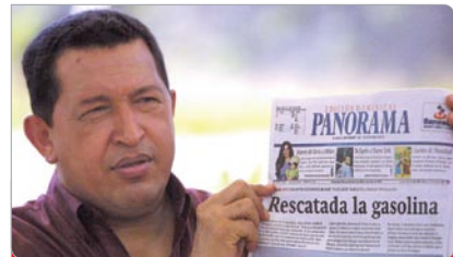
Hugo Chávez, presidente de la República Bolivariana de Venezuela, en su programa de televisión “Aló Presidente”, número 132, realizado en la Planta de Petróleos de Venezuela en Carenero, estado Miranda.

7 Entre el 09 de febrero y el 03 de marzo de 2003 , la empresa petrolera de Arabia Saudita, Saudi Aramco, envió a Venezuela dos cargamentos de gasolina en el buque tanque “Fulmar”, estas remesas impulsaron la estabilización del suministro de combustible en el mercado interno.