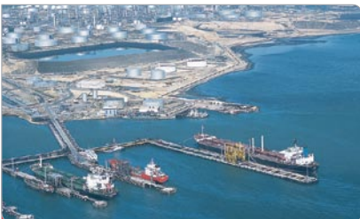
Venezuela recibió el apoyo de buques petroleros provenientes del exterior para el abastecimiento y suministro de combustible.

3 A pesar de los intentos de los saboteadores para impedir el apoyo internacional, más de 32 cargamentos de combustible arribaron a puertos venezolanos desde otras naciones, entre ellos una remesa gratuita que envió Qatar a finales del mes de diciembre. El 05 de enero de 2003 llegó el buque “Amazon Explorer”, con 519 mil barriles de gasolina provenientes de Brasil, para abastecer el oriente del país y apoyar el suministro del Área Metropolitana.