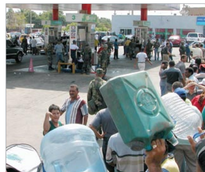
El sabotaje petrolero frenó la producción y distribución de crudo y sus derivados.

1 En diciembre de 2002 , los autodenominados “ meritócratas petroleros ” perpetraron un paro sabotaje durante 63 días contra la principal industria del país, lo cual ocasionó graves daños a las instalaciones petroleras, el desabastecimiento nacional e internacional y obligó a Venezuela, quinto país productor de crudo del mundo, a importar combustible.