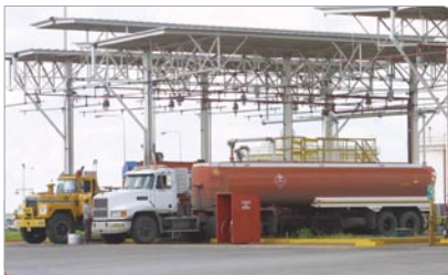
Abastecimiento de combustible para ser distribuido en los estados orientales Delta Amacuro, Sucre y Anzoátegui.

5 El 09 de enero de 2003 , Venezuela se vió obligada a comprar combustible a traders . Es así como llegó el buque tanque “Posavina” con 265 mil barriles de gasolina y entraron al país otros cargamentos con diesel, lo que permitió estabilizar el suministro al mercado interno. La normalización de la entrada y salida de buques demostró a las navieras del mundo que en Venezuela operaban puertos seguros.