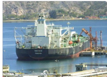
El Nereo, que zarpó hacia Corpus Christy, EEUU, con 600 mil barriles de crudo a bordo.

8 Para sorpresa de propios y extraños, el 11 de abril de 2003 , PDVSA anunció la recuperación total de los niveles de producción a 3 millones 200 mil barriles diarios y el restablecimiento de sus operaciones, gracias al esfuerzo conjunto del pueblo venezolano, los trabajadores de la Nueva PDVSA y la solidaridad internacional.