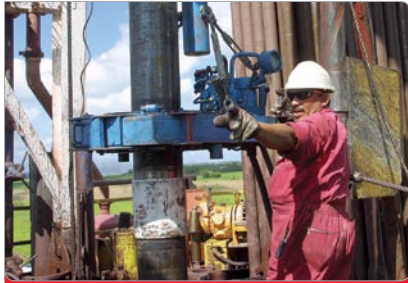
Gracias al colosal esfuerzo de los trabajadores de la Nueva PDVSA fue posible el restablecimiento de la industria petrolera.

10 Con la derrota del sabotaje petrolero, el Gobierno Bolivariano, a través del Ministerio de Energía y Petróleo y la Nueva PDVSA, aceleró la ejecución de la Política de Plena Soberanía Petrolera, mediante la cual se impulsa el fortalecimiento de la OPEP, la diversificación de los mercados y la integración energética de Latinoamérica y el Caribe para el bienestar de los pueblos. ■