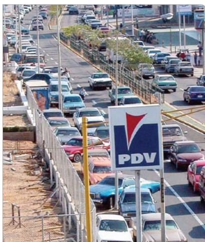
El pueblo venezolano sufrió el desabastecimiento de combustible.

Hoy, a 4 años de la derrota del sabotaje petrolero, Venezuela ha consolidado su posicionamiento geoestratégico mediante la firma de más de un centenar de acuerdos de cooperación energética con países de los cinco continentes, lo cual ratifica los principios de solidaridad y complementariedad entre los pueblos en la consecución de un mundo pluripolar más justo y equilibrado