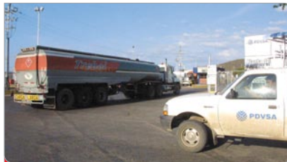
Las gandolas esperan para cargar combustible en el Llenadero de Guaraguao, en Puerto La Cruz.

4 El 07 de enero de 2003 Venezuela comenzó un proceso de intercambio de crudo por combustible con la empresa PETROTRIN de Trinidad y Tobago. La primera embarcación enviada fue el “Nordanvin” con 235 mil barriles de gasolina. Posteriormente, el buque tanque Maritza Sayalero, rebautizado como “Negra Hipólita”, comenzó a cubrir esta ruta para satisfacer el suministro en el oriente del país.