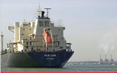
El rescate del Pilín León representó una victoria contra el sabotaje.

2 Durante 17 días los marinos sumados a las acciones de sabotaje paralizaron el tanquero Pilín León, buque rebautizado como “Negra Matea” tras su recuperación el 21 de diciembre de 2002 , cuando su nueva tripulación logró movilizarlo hasta el puerto Bajo Grande en el Lago de Maracaibo. Este hecho marcó el inicio de la épica batalla del pueblo venezolano para derrotar el sabotaje petrolero.