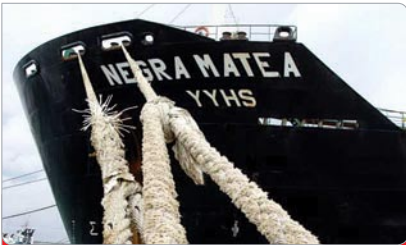
El tanquero Pilín León fue rebautizado como “Negra Matea” luego de ser recuperado.

2 Durante 17 días los marinos sumados a las acciones de sabotaje paralizaron el tanquero Pilín León, buque rebautizado como “Negra Matea” tras su recuperación el 21 de diciembre de 2002 , cuando su nueva tripulación logró movilizarlo hasta el puerto Bajo Grande en el Lago de Maracaibo. Este hecho marcó el inicio de la épica batalla del pueblo venezolano para derrotar el sabotaje petrolero.