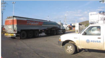
Las gandolas esperan para cargar combustible en el Llenadero de Guaraguao, en Puerto La Cruz.

4 El 07 de enero de 2003 Venezuela comenzó un proceso de intercambio de crudo por combustible con la empresa PETROTRIN de Trinidad y Tobago. La primera embarcación enviada fue el “Nordanvin” con 235 mil barriles de gasolina. Posteriormente, el buque tanque Maritza Sayalero, rebautizado como “Negra Hipólita”, comenzó a cubrir esta ruta para satisfacer el suministro en el oriente del país.