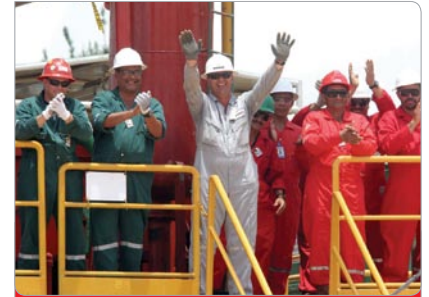
Trabajadores de la industria celebran el fin del paro petrolero y el inicio de la Nueva PDVSA.

10 Con la derrota del sabotaje petrolero, el Gobierno Bolivariano, a través del Ministerio de Energía y Petróleo y la Nueva PDVSA, aceleró la ejecución de la Política de Plena Soberanía Petrolera, mediante la cual se impulsa el fortalecimiento de la OPEP, la diversificación de los mercados y la integración energética de Latinoamérica y el Caribe para el bienestar de los pueblos. ■