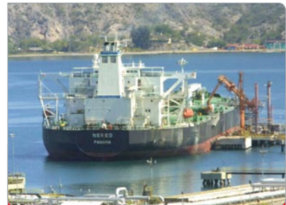
El Nereo, que zarpó hacia Corpus Christy, EEUU, con 600 mil barriles de crudo a bordo.

8 Para sorpresa de propios y extraños, el 11 de abril de 2003 , PDVSA anunció la recuperación total de los niveles de producción a 3 millones 200 mil barriles diarios y el restablecimiento de sus operaciones, gracias al esfuerzo conjunto del pueblo venezolano, los trabajadores de la Nueva PDVSA y la solidaridad internacional.